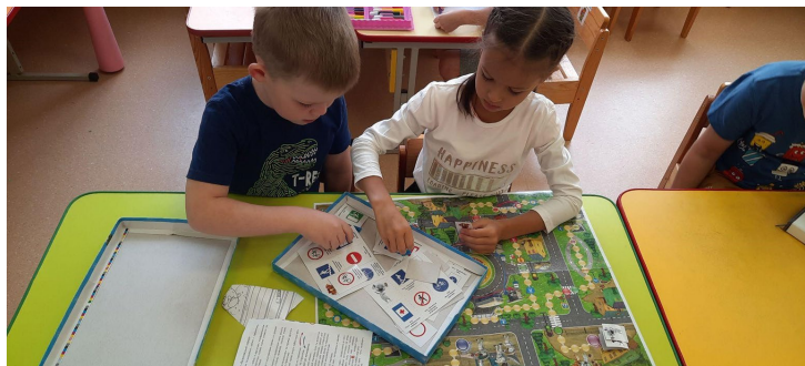
Дидактическая игра “Безопасный город” ПДД для детей