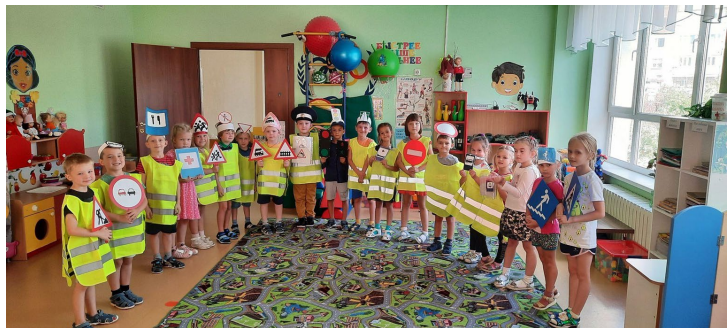
Стихи для старшей группы “Дорожные знаки”