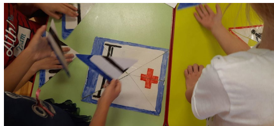
Пазлы “Дорожные знаки”