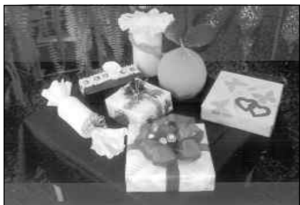
Варианты праздничной упаковки

воспитатель МДОУ ЦРР — д/с № 123, г. Воронеж